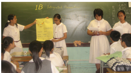
課堂進行匯報，訓練同學協作和溝通的能力。