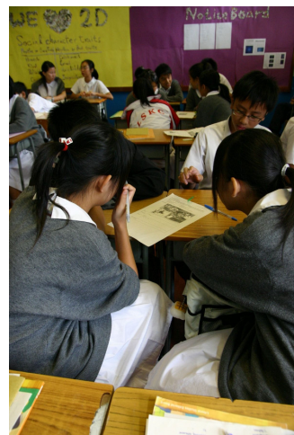
透過小組討論，提高同學的學習興趣。